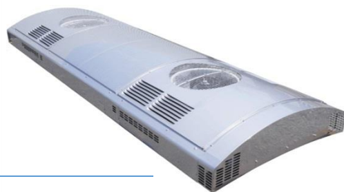
Крышный кондиционер для ж.д. вагона с электроприводом