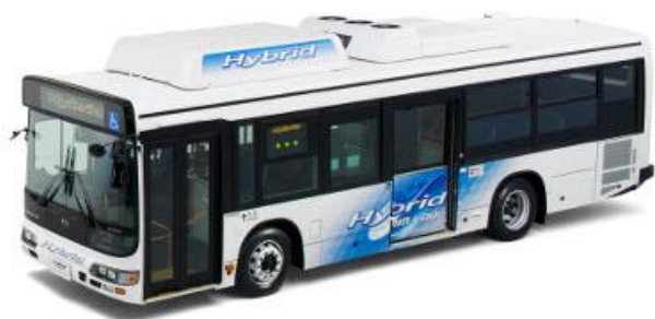
Крышный автобусный кондиционер с электроприводом