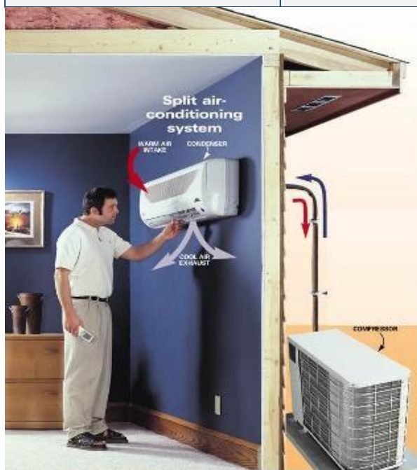
Раздельное оборудование кондиционирования воздуха: настенный внутренний блок и наружный блок