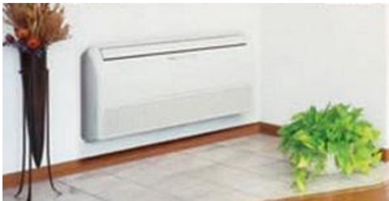
Раздельное оборудование кондиционирования воздуха: внутренний блок напольного уровня