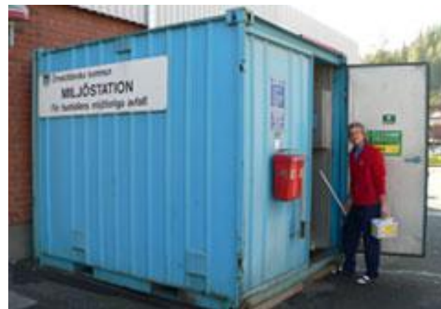
Сбор бытовой химии