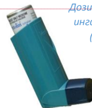
Дозирующий ингалятор (ДИ)

В ряде направлений применения аэрозольной продукции существуют конкурирующие продукты, основанные на замещающих технологиях, а именно ручные распылители, роликовые жидкие продукты (например, для дезодорантов) и продукты без распыления (например, для полировки и смазки). Предпочтение часто отдается аэрозольной продукции из-за простоты использования, несмотря на то, что она может стоить дороже, чем некоторые конкурирующие технологии. В медицинской области препараты для лечения респираторных заболеваний могут приниматься либо путем принятия аэрозольных препаратов (дозирующие ингаляторы), либо путем применения порошковой ингаляции. Большинство препаратов, доступных в виде дозирующих ингаляторов, также доступны в виде сухих порошковых ингаляторов (СПИ).