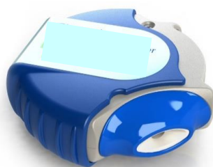
Сухой порошковый ингалятор для приема лекарств, действующих на органы дыхания