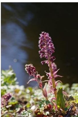
Белокопытник гибридный - Petasites hybridus (L.) Gaertn.

Кустарник высотой 30-120 см. Цветет в апреле – мае. Произрастает в смешанных и лиственных лесах, среди кустарников, на достаточно богатой и влажной почве. Встречается по всей территории, довольно часто. Количество мест и общая площадь в Беларуси – 247 местонахождений (154,2 га).