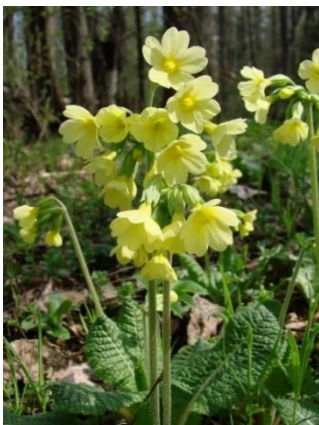
Первоцвет высокий - Primula elatior (L.) Hill.

Многолетнее травянистое растение высотой 10-15 см. Цветет в апреле – мае. Произрастает в широколиственно-еловых и мелколиственных лесах, среди кустарников, в поймах рек. Встречается в северных и центральных районах республики довольно часто, местами образует заросли, на юге встречается редко. Количество мест и общая площадь в Беларуси – 115550 местонахождений (21466,2 га).