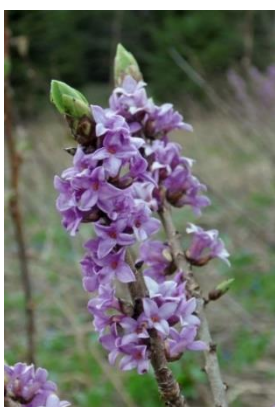
Волчник обыкновенный - Daphne mezereum L.

Многолетнее травянистое растение высотой 20-30 см. Цветет в апреле – мае. Произрастает на низинных закустаренных лугах, у истоков ручьев. Встречается в Пуховичском районе Минской области, в ряде районов Витебской области, в Каменецком районе Брестской области, очень редко. Количество мест и общая площадь в Беларуси – 18 местонахождений (1,8 га).