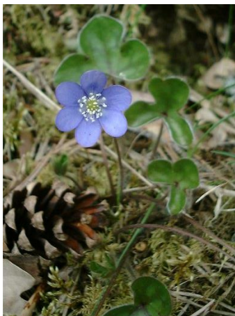
Перелеска благородная – Neratica nobilis Mill.